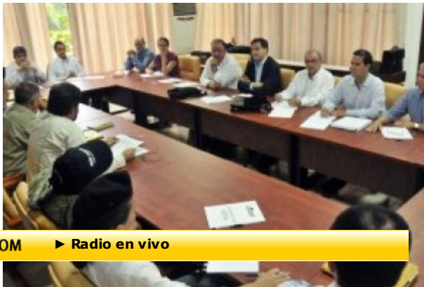
▶ Diálogos de paz