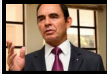
Condena a 37 años es desproporcionada e injusta: general (r) Uscátegui