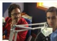
Antequera y Uscátegui; una mirada joven sobre las víctimas del conflicto