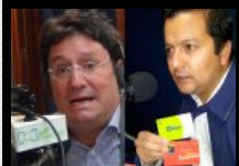
David Luna y Pacho Santos debaten sobre propuestas presidenciales para Bogotá