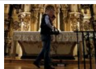
Delimitan cinco zonas donde podría reposar Cervantes en una iglesia de Madrid