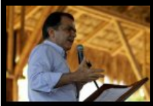
Oscar Iván Zuluaga cancela debate por fuerte cuadro gripal